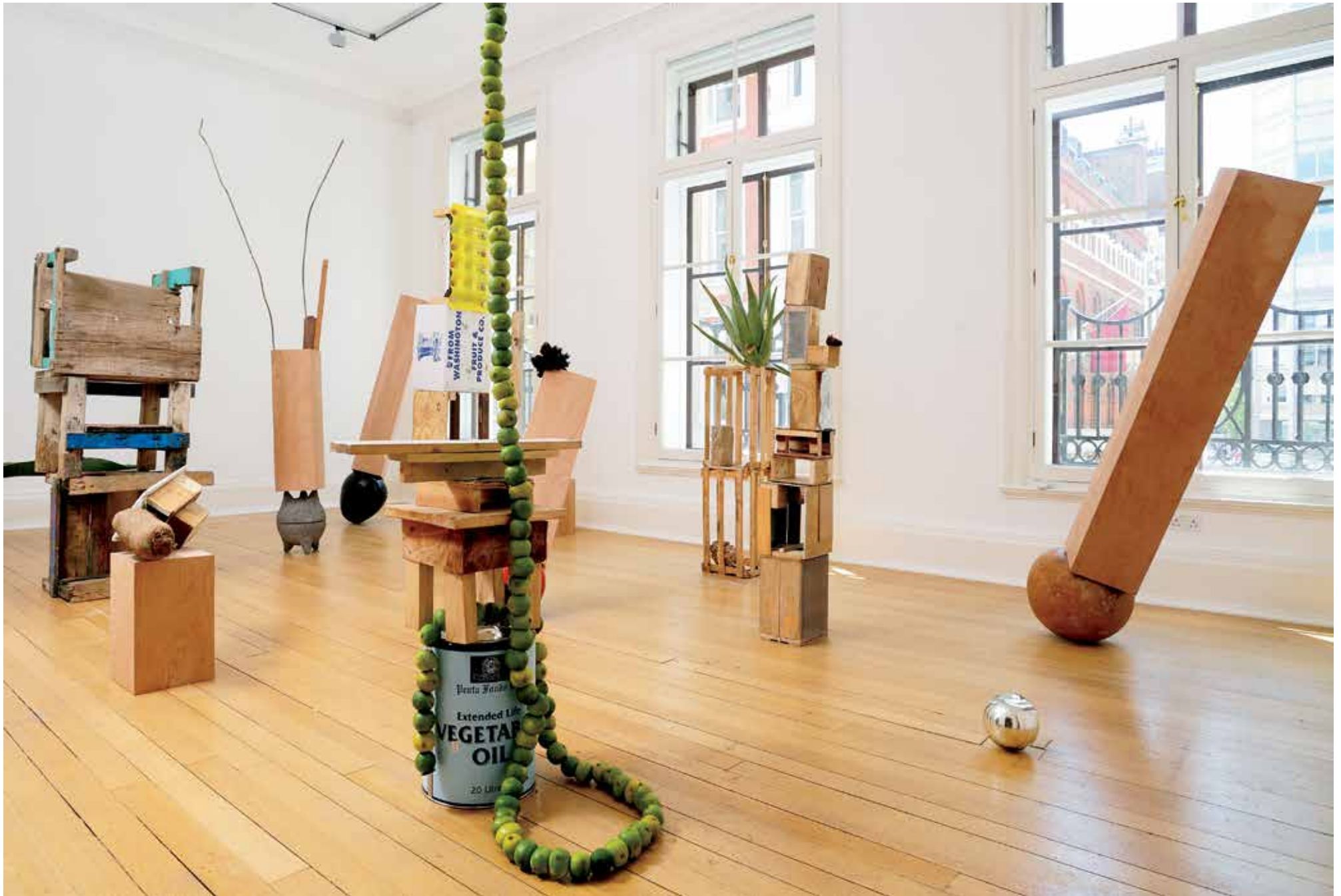
Autoconstrucción Room [Sala de autoconstrucción], 2009 Colección D. Daskalopoulos