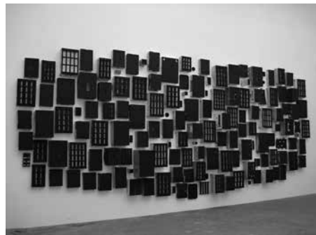
Haussmannian Leftovers: Richard Lenoir [Sobras Haussmanianas: Richard Lenoir], 2007 Colección Jumex, México